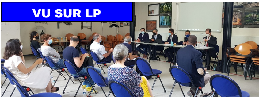
« Bilan de la commission de l'évaluation du lycée : décroissez-vous ! »