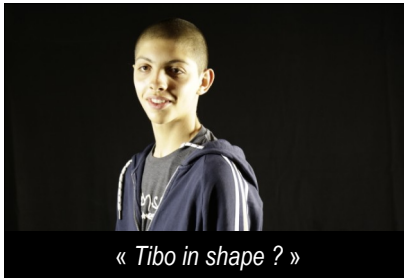
« Tibo in shape ? »

En quelques mots, la MGI est un centre de recherche et d'éducation artistique qui propose aux établissements scolaires de Paris et d'Île-de-France des parcours artistiques encadrés par des artistes professionnels pour faire découvrir, entre autres, les arts visuels et sonores. C'est ce qu'ont découvert nos élèves : la vidéo, la photographie et le son.