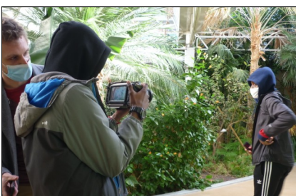
« Le cadrage mon garçon, le cadrage ! »

Nos élèves ont ensuite enregistré leurs textes en utilisant une perche et se sont filmés pour témoigner des (in)égalité(s).